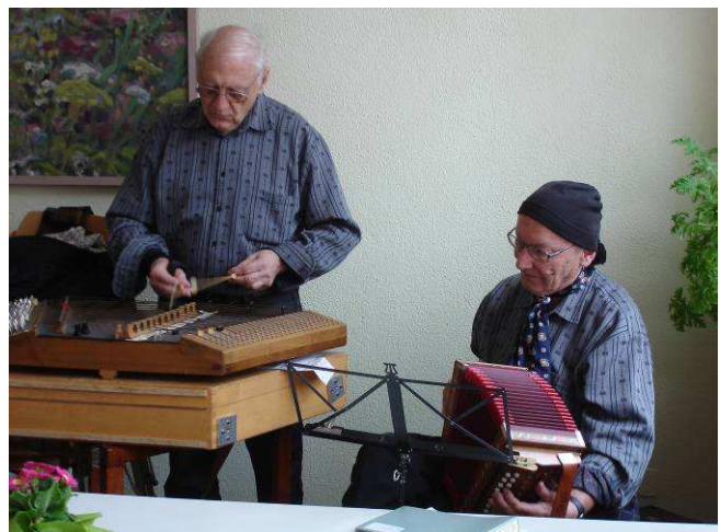
Musizieren für den Mayenfels