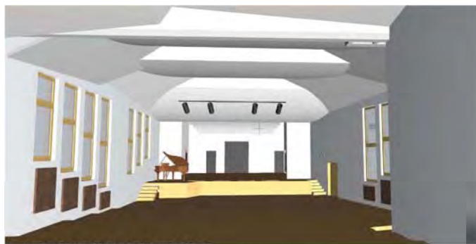
Saal mit Decke Blick Richtung Bühne

So entwickelt sich also die Saalgestaltung von Sitzung zu Sitzung weiter: der Übergang von der Decke zu den Wänden, der Einbezug der Trennwand, die Höhe der Bühnenöffnung, der Anstiegswinkel der Stuhlreihen usw. auch hier ist also vieles noch in Bewegung, bis es schliesslich zur Realisierung kommt.